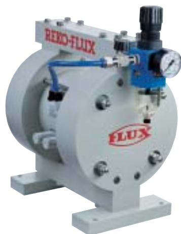
RFM 25/PP komplett med filter-regulator